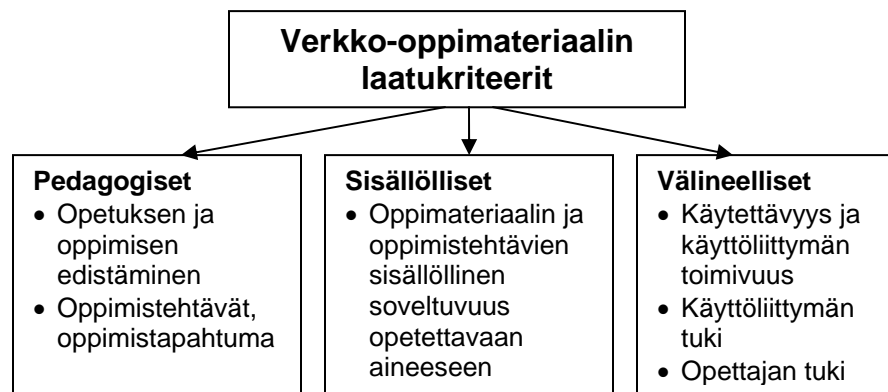
Kuva3. Verkko-oppimateriaalien laatukriteeriluokittelu

Verkko-opetuksen kokonaissuunniteluun liittyy kiinteästi sisältöjen, oppimistehtävien sekä oppimisen pedagogisen ja välineellisen tuen yhteen toimivuuden varmistaminen. Sisältöjen, oppimistehtävien sekä tuen tulee olla linjassa oppimisen tavoitteisiin ja arviointiin. Kun nämä asiat on otettu huomioon verkkokurssia suunniteltaessa, on mahdollisuus tuottaa oppimisen kannalta laadukas kokonaisuus. Herrington 6 jaottelee kolme laadunarviointikriteeriryhmää: pedagoginen, sisällöllinen sekä välineellinen. (kuva 3).